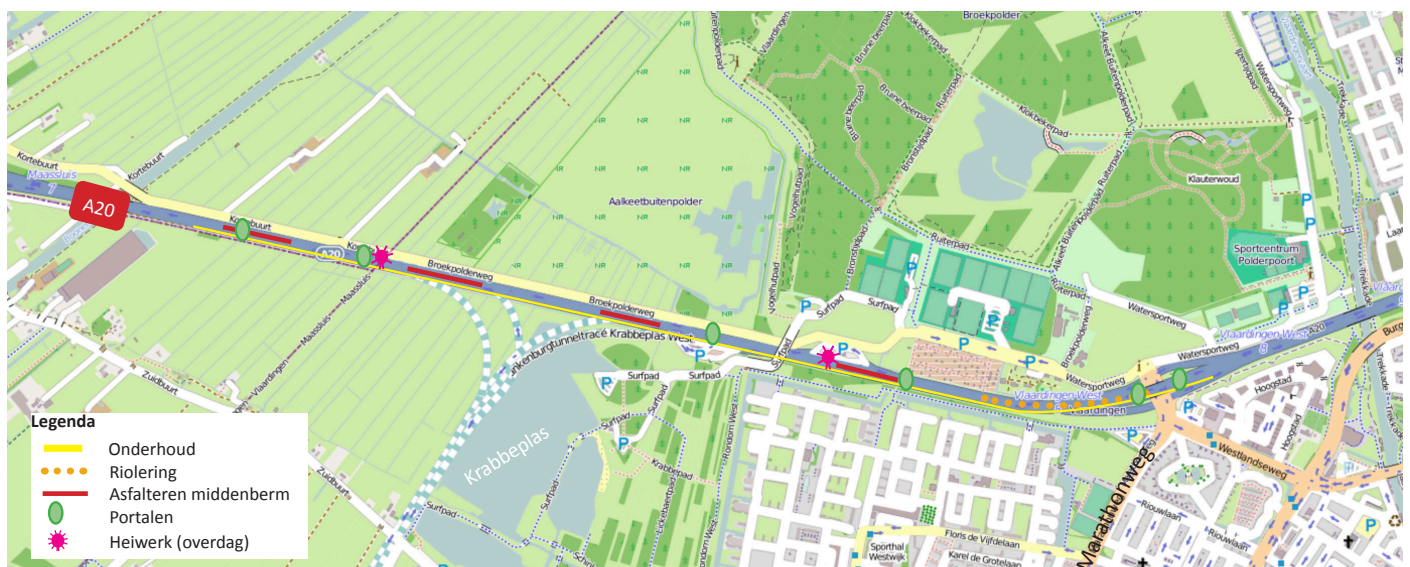
Afbeelding 1 Locatie werkzaamheden A20

Het werk op de A20 gaat tussen 28 en 31 mei dag en nacht door. Dit zorgt voor geluid in de omgeving. Omdat het heien van palen veel hinder geeft, doen we dit op vrijdag en zaterdag overdag. In de nachten kunt u geluid horen van het verwijderen en plaatsen van geleiderail. Bij het plaatsen slaan we palen in de grond en bevestigen hieraan de rail. Verder hoort u mogelijk graafwerk en wegwerkzaamheden zoals het frezen van asfalt, slijpen van het wegdek voor het aanbrengen van detectielussen en asfalteren. Mogelijk ziet u de verlichting van de bouwplaats.