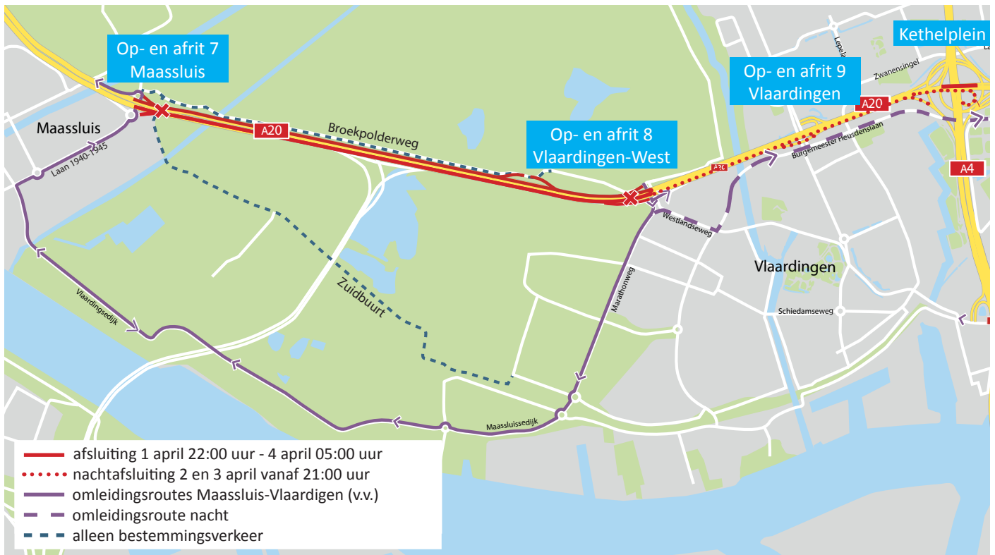
Afbeelding 4 Afsluiting A20 van vrijdag 1 april 22:00 uur tot maandag 4 april 05:00 uur (opritten vanaf 21:00 uur) en lokale omleidingsroutes

BAAK legt in opdracht van Rijkswaterstaat de Blankenburgverbinding aan. De nieuwe weg verbindt de A15 en de A20 tussen Rozenburg en Vlaardingen en verbetert de bereikbaarheid van de bedrijven in het Rotterdamse havengebied en in Greenport Westland.