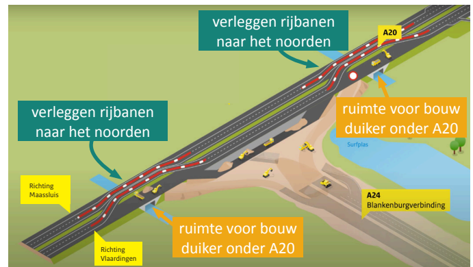
Afbeelding 1 Verleggen rijstroken A20 voor bouw duikers onder de snelweg

De wanden van de duikers maken we met damwanden. Een deel van de stalen damwanden moet dicht bij de snelweg worden aangebracht. Daarom trillen we deze op zaterdag 2 en zondag 3 april tussen 07:00 en 19:00 uur in de grond.